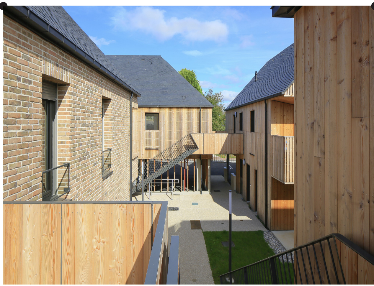
Le nouvel îlot s'est dessiné dans une variété de formes et de matériaux s'inspirant des modèles de constructions traditionnelles : colombages, bardage bois, essentage ardoise, parements en briques.

Surface 1 114 m 2 de surface de plancher de logements