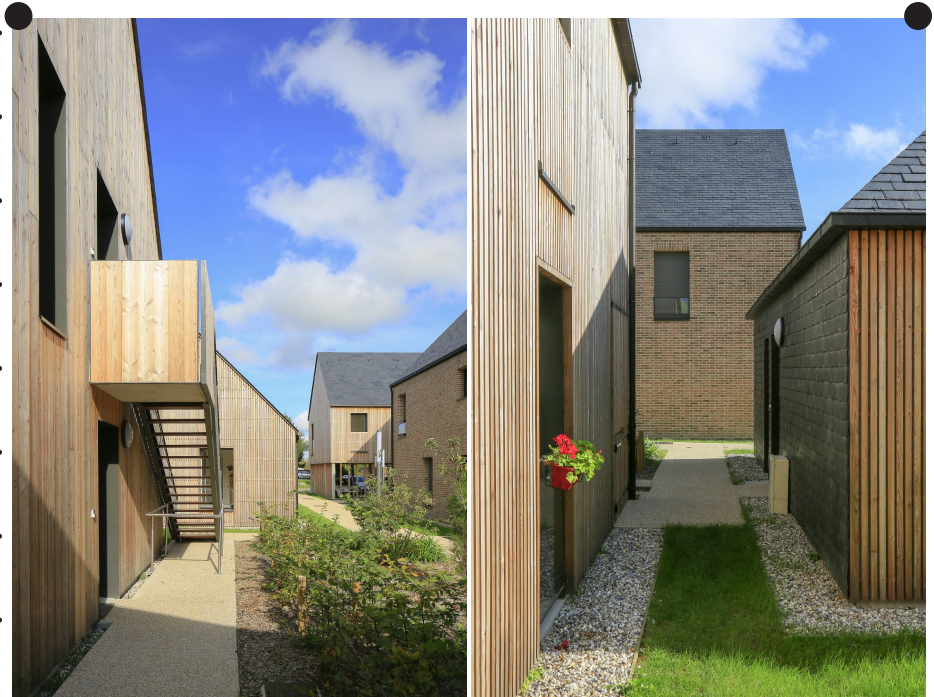
Exemple de traitement des limites entre espaces de circulation et espaces privés