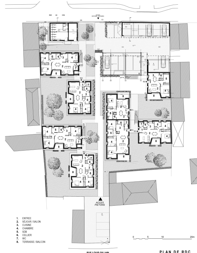
Plan de RDC de la Résidence Gillain Crédits : ATELIER BETTINGER DESPLANQUES