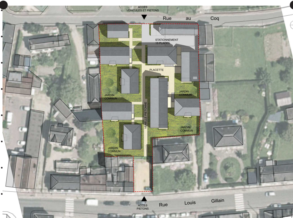
Plan masse de la Résidence Gillain et de son intégration urbaine Crédits : ATELIER BETTINGER DESPLANQUES