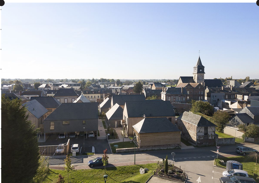
Inscription de la Résidence Gillain et de sa venelle centrale dans le centre-bourg de Beuzeville