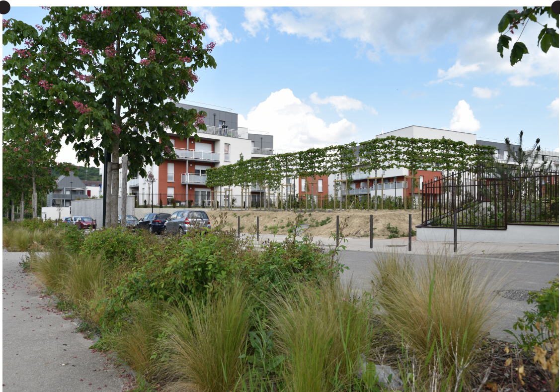
Les Grands Jardins L'aménagement intègre des choix végétaux variés : essences locales, arbustes, rosiers, graminées et plantations diversifiées visant à renforcer la résilience écologique.