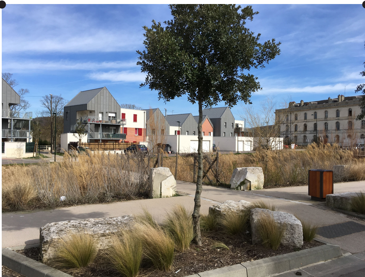
La Grande Prairie ©EAD - Un soin particulier est apporté à la gestion des eaux pluviales et à la renaturation des sols.