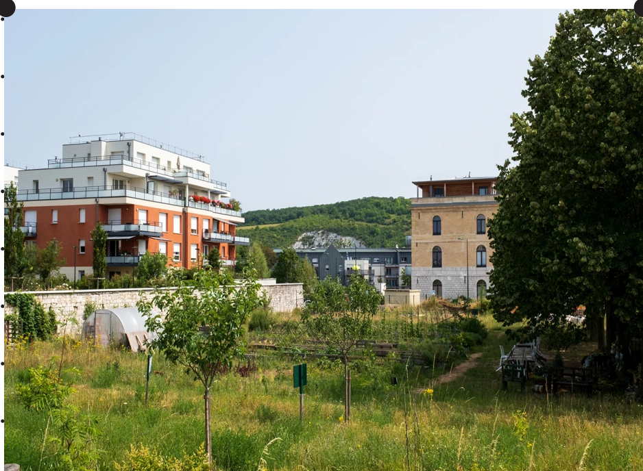
Les Jardins Partagés ©EAD - Une grande promenade, une prairie, des jardins pédagogiques, un potager participatif de 5 000 m 2 et un espace de biodiversité de plus de 10 000 m 2 font de l'Ecoquartier Fieschi un réel "parc habité".