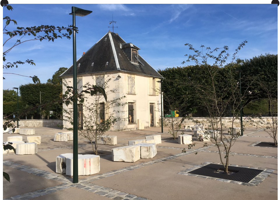
Place Jean-Paul II ©EAD - Le projet se distingue par la valorisation de son patrimoine bâti, avec la conservation et la réhabilitation de sept bâtiments emblématiques tels que le couvent des Capucins, le bâtiment du régiment ou encore le pavillon historique. Ces édifices deviennent des socles identitaires forts, accueillant de nouveaux usages : habitat, tiers-lieu d'entrepreneuriat durable, espaces partagés, locaux d'activités économiques.