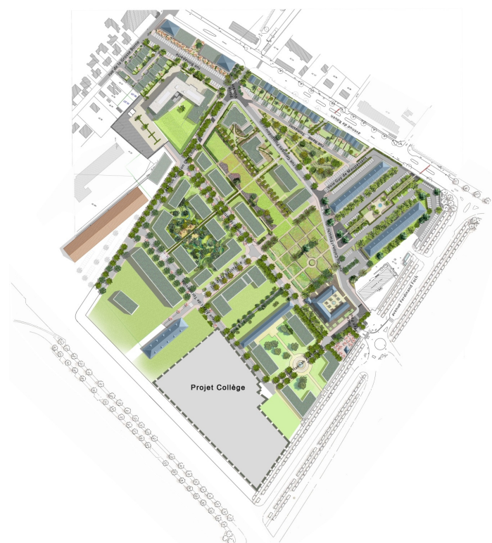
Le plan d'aménagement