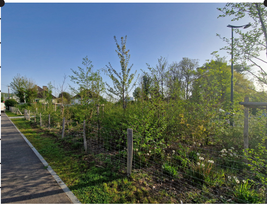
La biodiversité est renforcée par la densification des plantations et des espaces verts