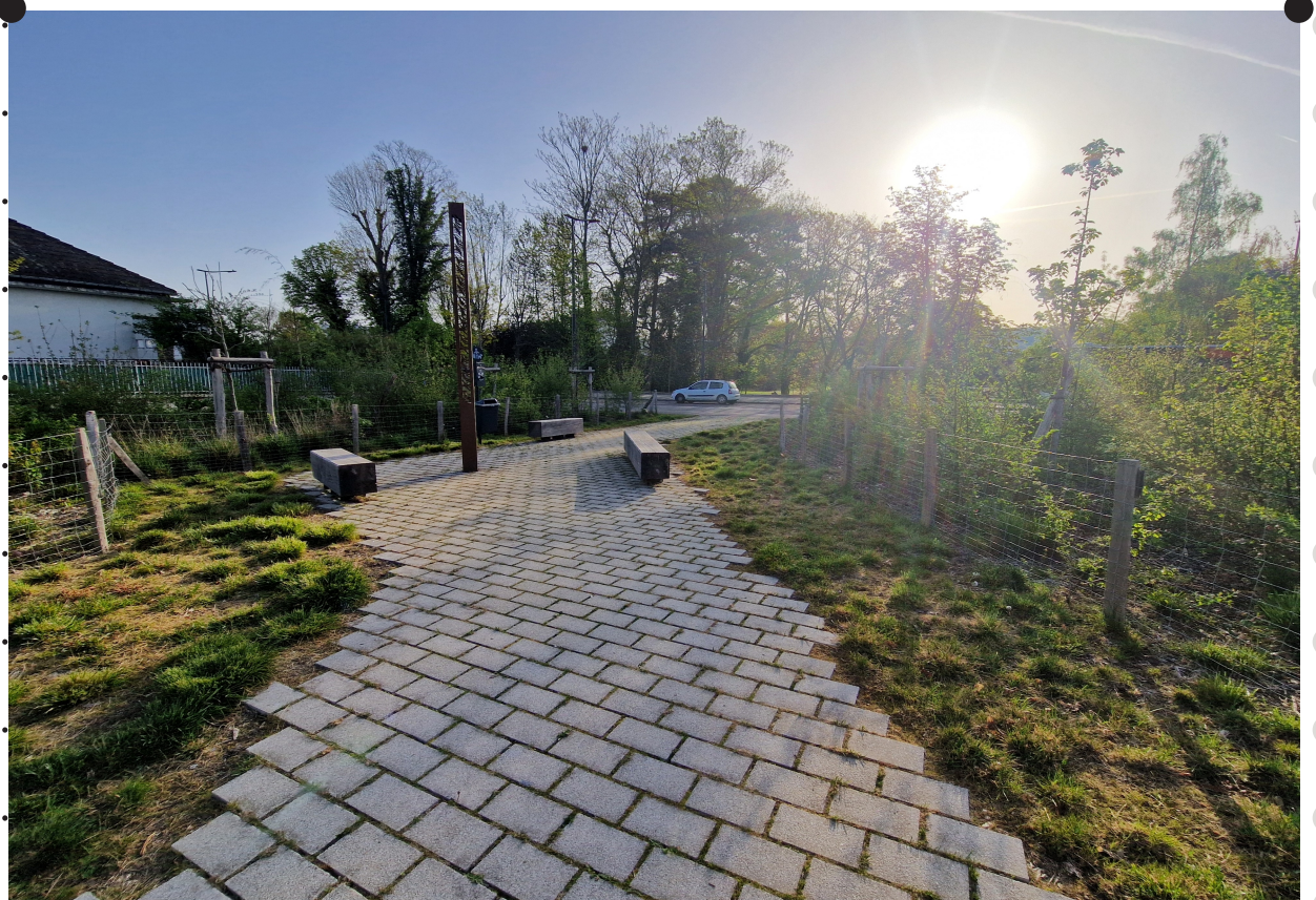
L'espace créé peut être utilisé par les habitants et participe à l'amélioration de leur cadre de vie.