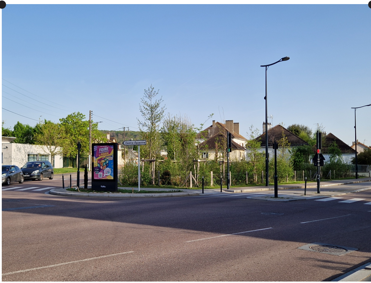
Le projet permet de limiter le ruissellement des eaux de pluies, en permettant l'infiltration complète dans le sol