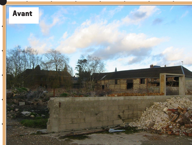
Friche de la ferme Debruyne