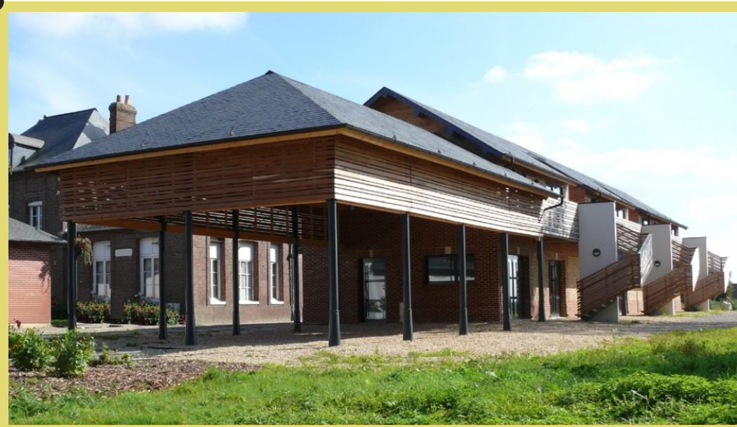
écoquartier des Arondes :Grange réhabilitée (logements, médiathèque, halles)