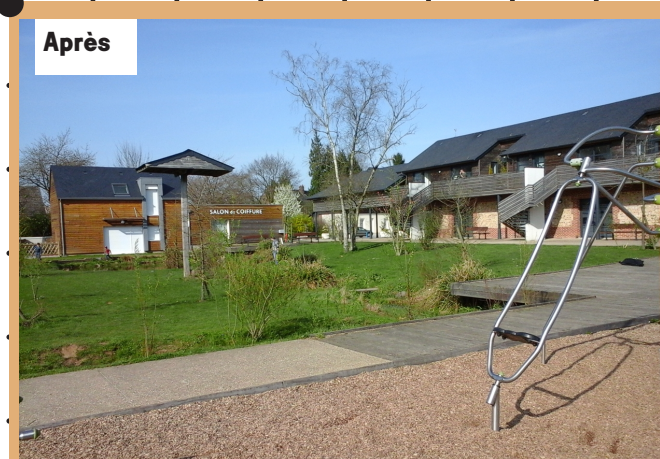
Grange réhabilitée, coiffeur et parc