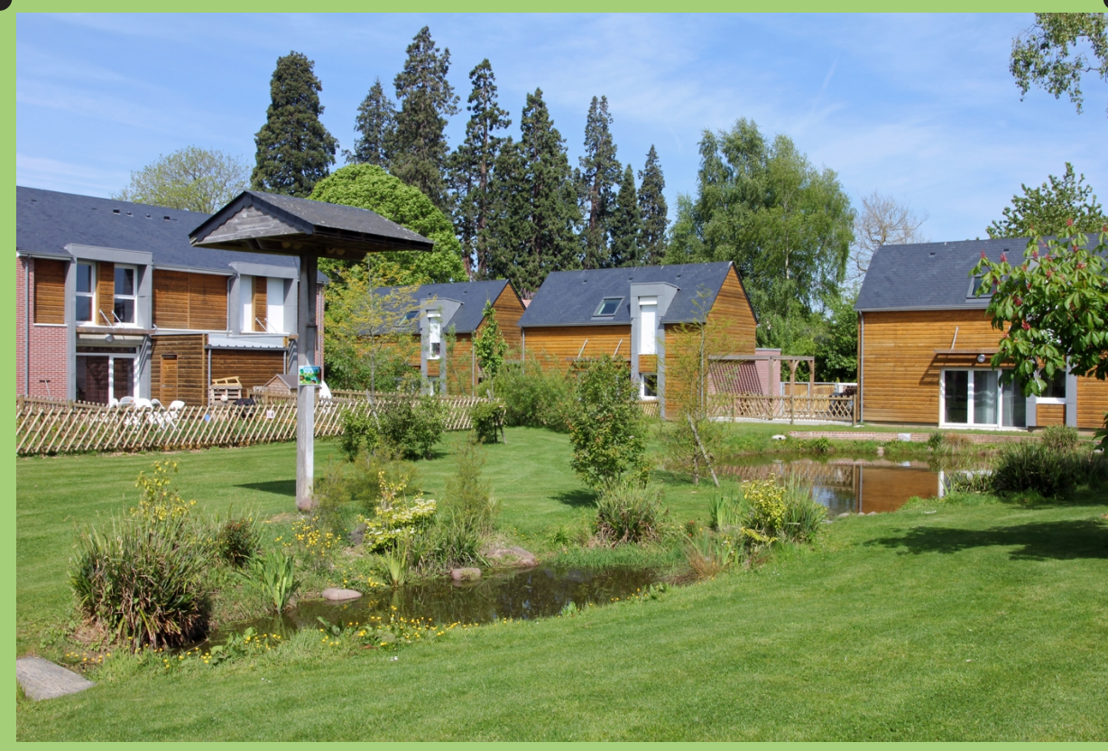
écoquartier des Arondes : arrière des maisons individuelles, tour à hirondelles, noues