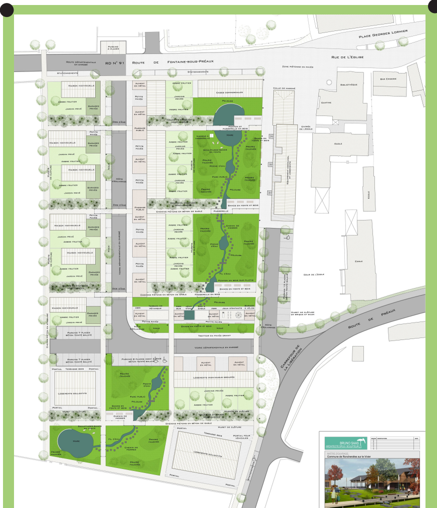
Plan masse de l'écoquartier des Arondes, espaces publics Crédits : plan de Bruno Saas, architecte DPLG