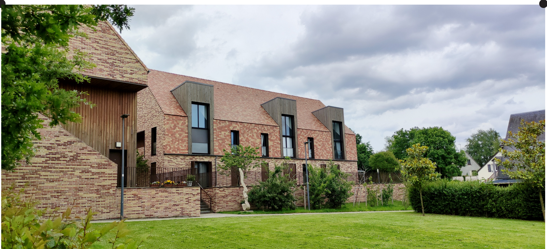
Les terrasses en surplomb préservent l'intimité des logements voisins du jardin public