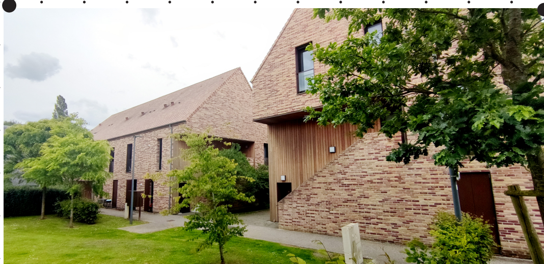
Une mixité de logements, végétalisés au pied des façades