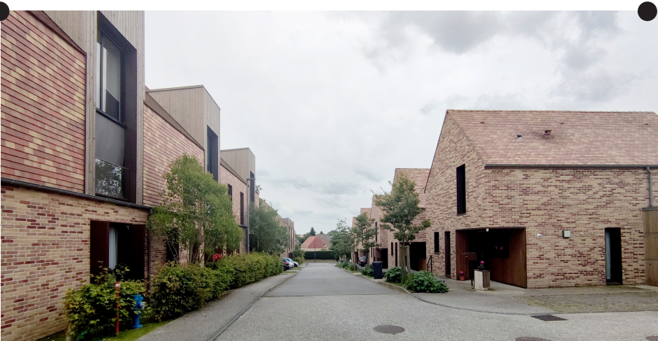
la rue de l'Herbier dessert le cœur de la résidence